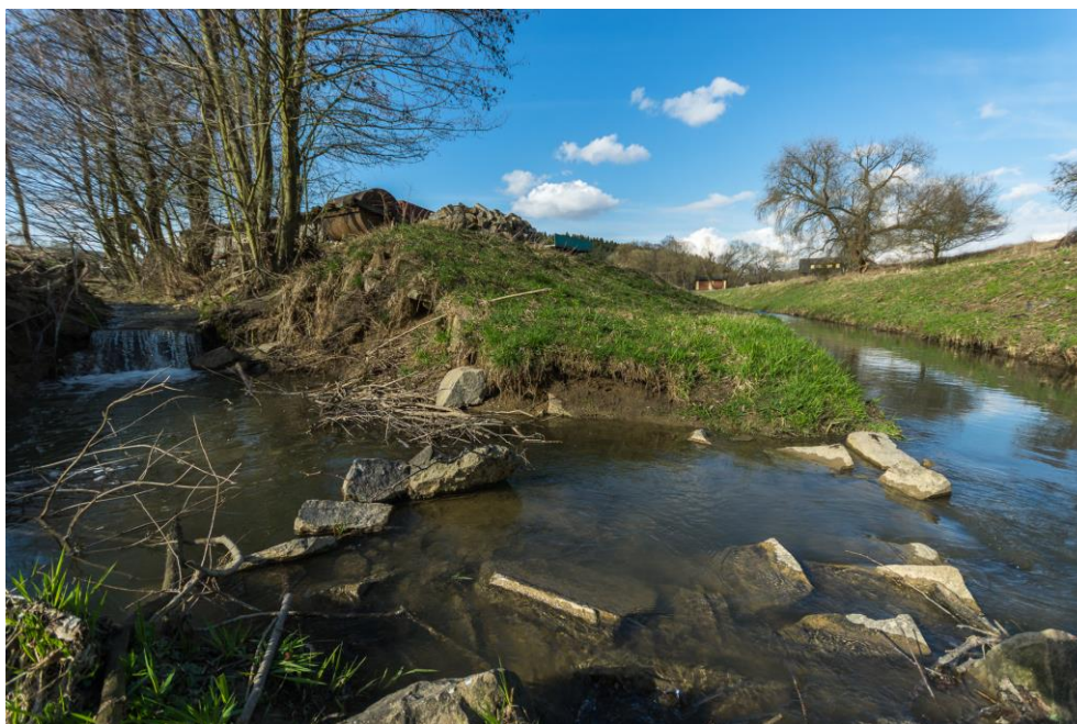
soutok Březnice a Hlubočského potoka

Od konce Bohuslavic opět tekl potok v přirozeném stavu, tj. meandroval v terénu. Tento jeho stav končí u mostu v části „Zelnice“, přibližně 150 metrů před dalším významnějším tentokrát pravostranným přítokem, kterým je Hlubočský potok pramenící mezi obcemi Lhota a Karlovice. Na něm se nachází jediná současná umělá díla na našem katastru. Rybník Hluboček vybudovaný v šedesátých letech 20. století, revitalizovaný v roce 2020 a nový letos vybudovaný rybník Lesů ČR. Nedaleko od jejich soutoku se od toku Březnice odděloval dlouhá léta mlýnský náhon, který byl veden po levém břehu potoka pod místní částí „Kozina“.