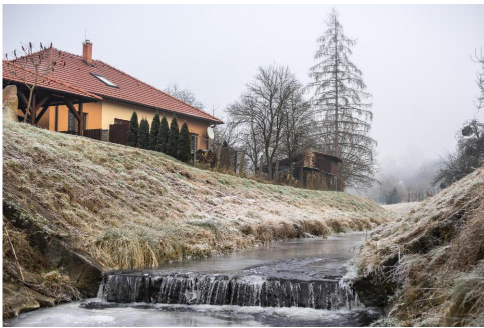
vodní tok Březnice v zimě u nás v Březolupích

Povodí obsahuje celé, nebo velkou část, katastrů těchto obcí: Březnice, Bohuslavicemi, Šarovy, Březolupy, Bílovice, Zlámanec, Svárov, Kelníky, Velký Ořechov, Částkov, Nedachlebice, Mistřice, Topolná, Kněžpole, Komárov, Karlovice a Lhota. Když se seznam pozorně přečtete, jsou tam téměř všechny obce Mikroregionu „Za Moravú“, jehož je naše malebná dědina součástí. Současně pak jsou v povodí Březnice všechny vesnice s nimiž máme společnou hranici katastrálního území. Březolupy pak, při „troše fantazie“, leží téměř uprostřed tohoto povodí.