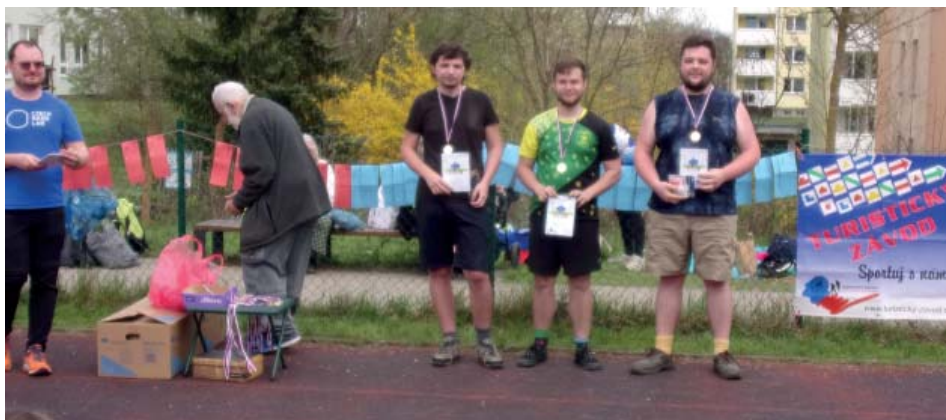
TZ Brno, kategorie chlapi