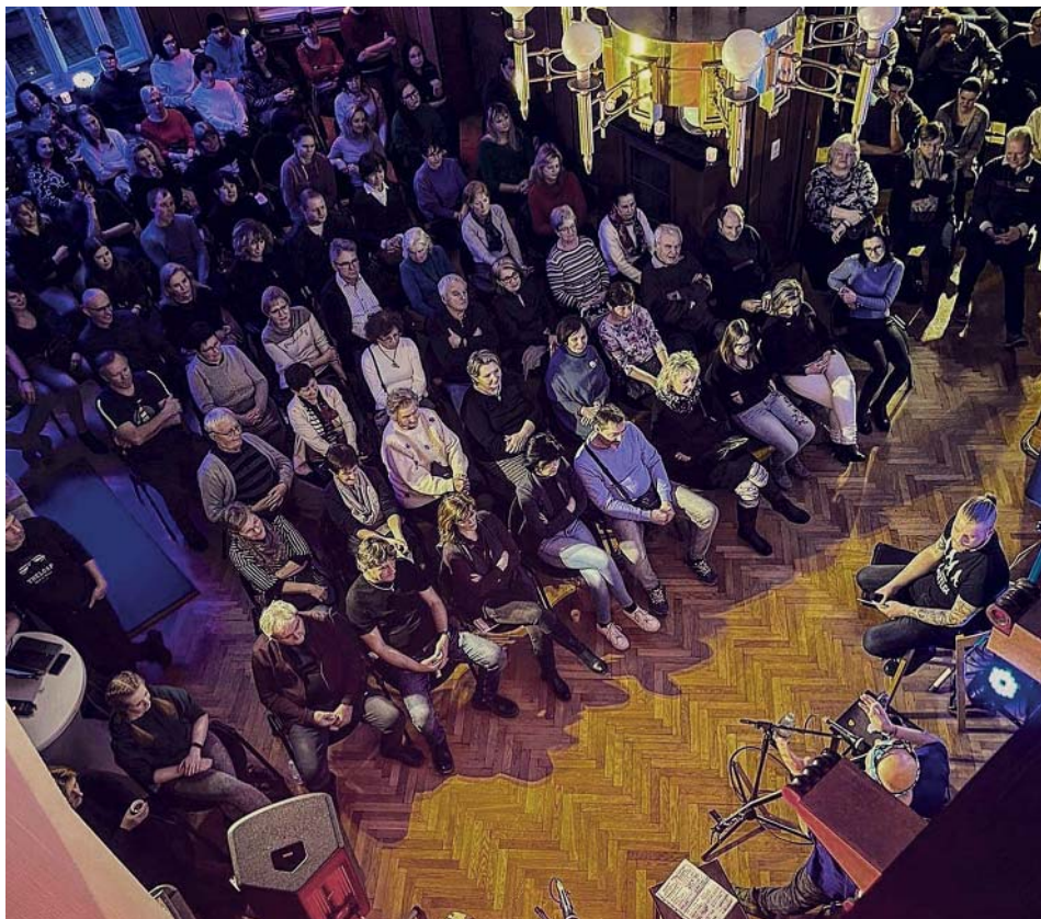
Klub důchodců „na čaji“ se skupinou Fleret a na šansonovém večeru