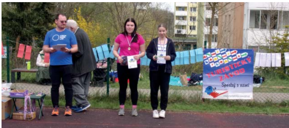
Turistický závod Brno, kategorie dívky