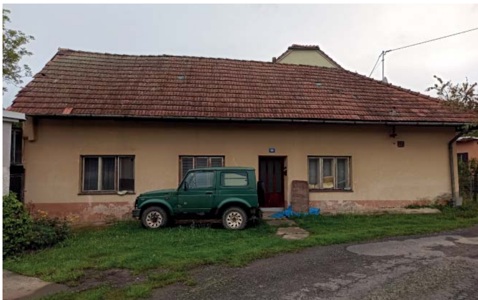
Současná fotografie domu č. 86