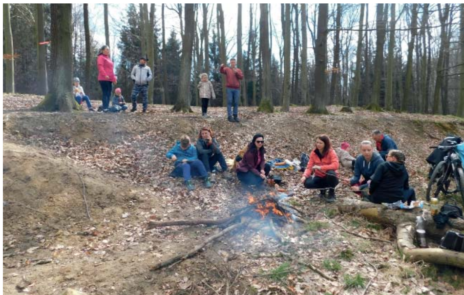
Opékání pod Zikmundovou skálou