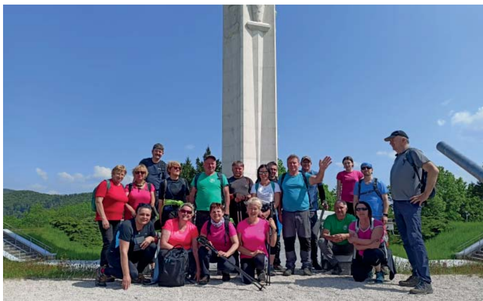
Spomienkový pochod s Brezolupskými