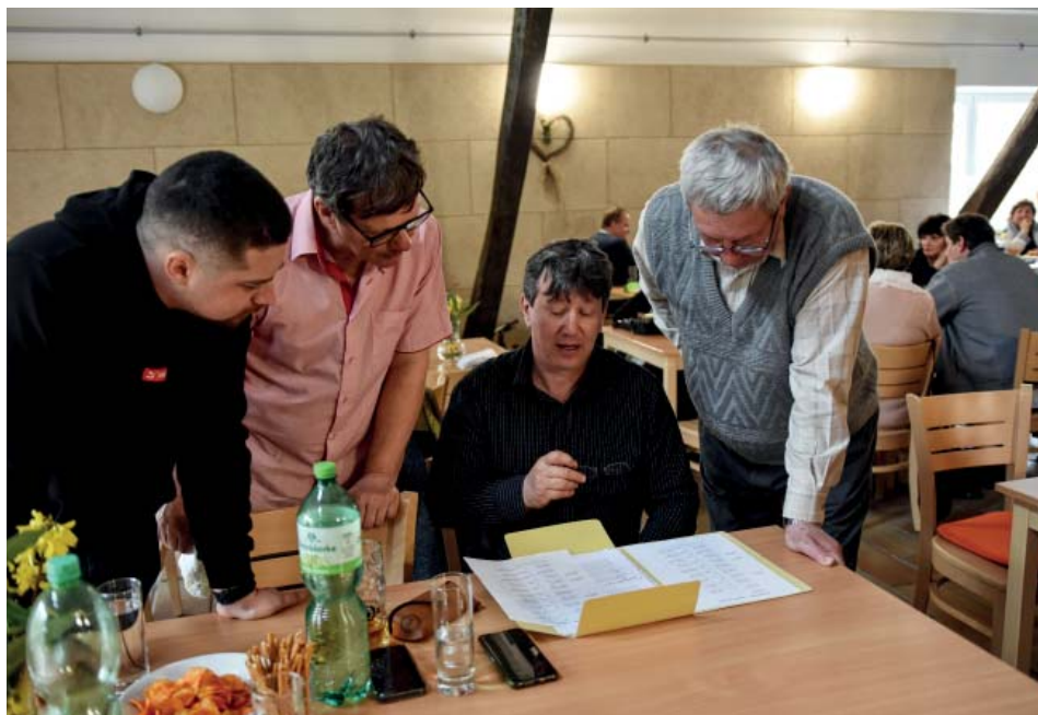
Debata nad předky

Sraz byl zahájen sdělením organizačních záležitostí a hned pokračoval „přednáškou“ o historii rodu, která byla dle sdělení účastníků velmi zajímavá. Po obědové pauze a společném focení následovala druhá část o současnosti rodů Berecka a Berečka a genetických testech. V mezidobí i po ukončení přednášek probíhala čilá diskuse podpořená tím, že jsme nejbližší členy rodů posadili ke stolu spolu. Někteří i více spříznění členové se viděli po delší době, někteří se pak viděli poprvé v životě.