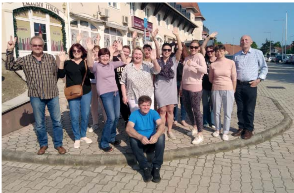
Ze zájezdu do termálních lázní Mošon v Maďarsku