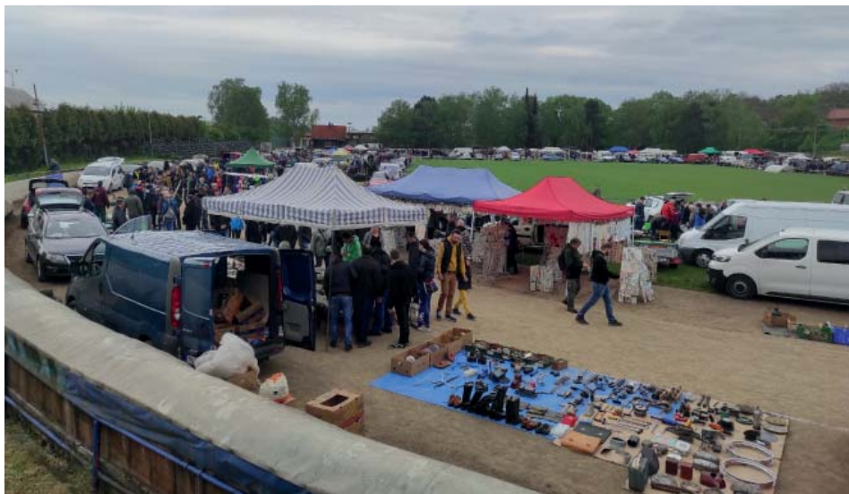
Auto-moto-burza 13. 5. 2023