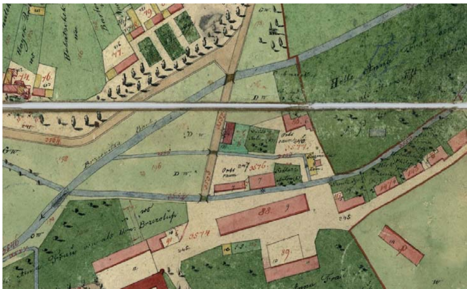
Výřez mapy obce Březolupy z roku 1828 (s domem č. 86)