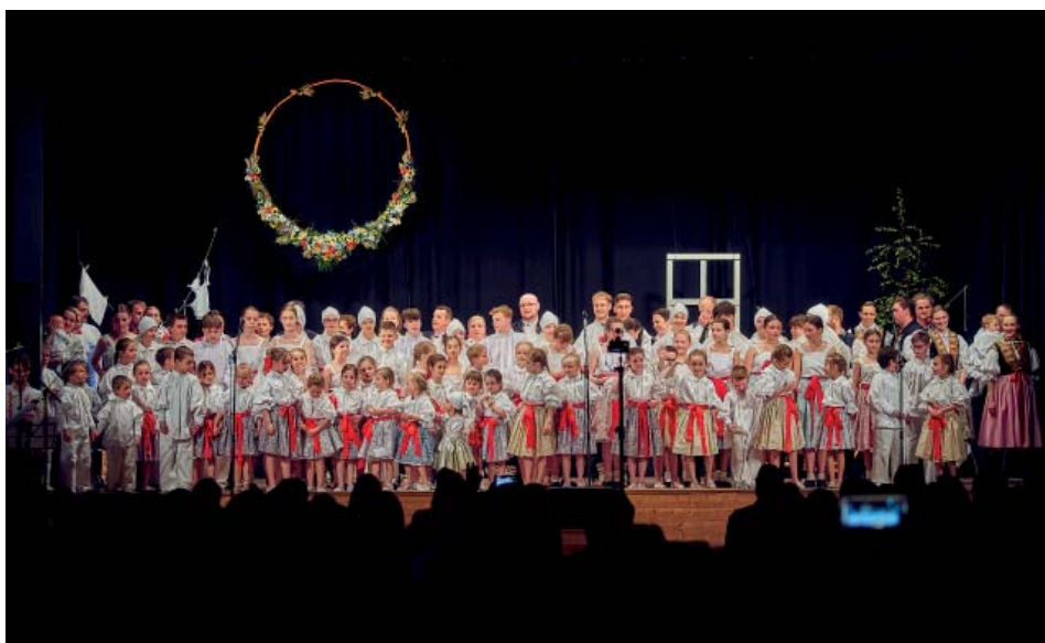
Ten Boží dar-vystoupení k 30. výročí souboru Botík