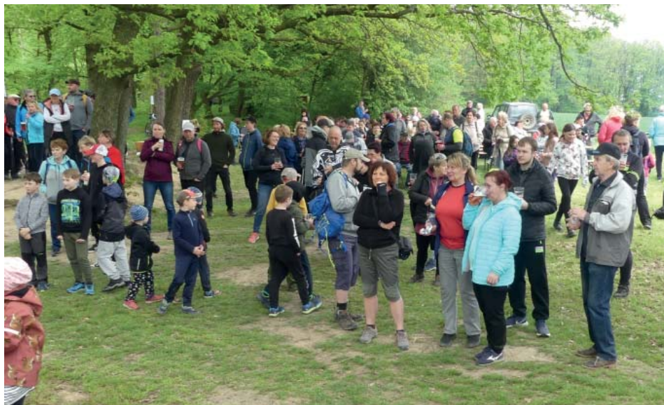
Setkání U Kameňa