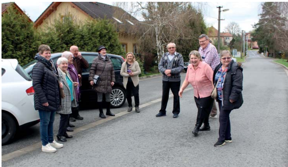
Velikonoční ladění s přáteli ze slovenských Brezolup