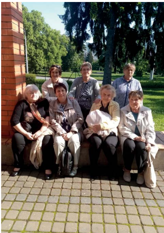
Klub důchodců v Baťově vile