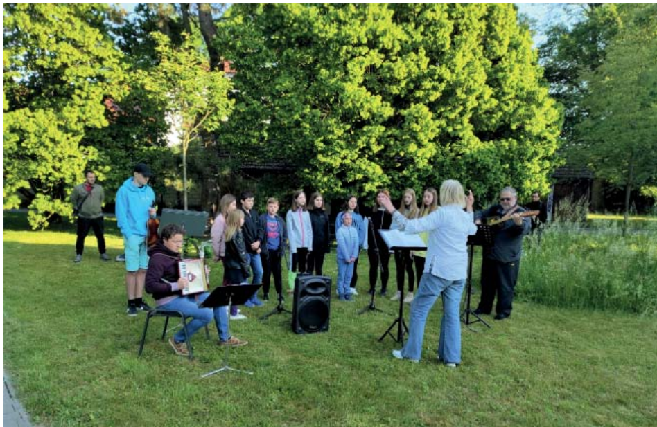
Sekáčům zazpívala Opičí kapela