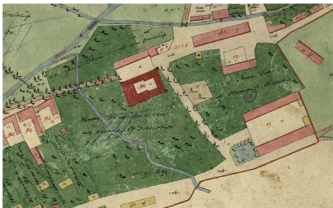
Zámek a okolí na mapě Stabilního katastru (1828)

V této části se vrátím ke své oblíbené a v několika článcích již citované Mapě stabilního katastru, která je pro Březolupy z roku 1828. Pořízena byla v první polovině 19. století za účelem získání dostatečně přesného měřického podkladu pro stanovování pozemkové daně. Nejdříve byly přesně vymezeny hranice pozemků. Takto označené pozemky byly posléze zaměřeny. Přesné trigonometrické zaměření provádělo v terénu několik polních měřičských skupin.