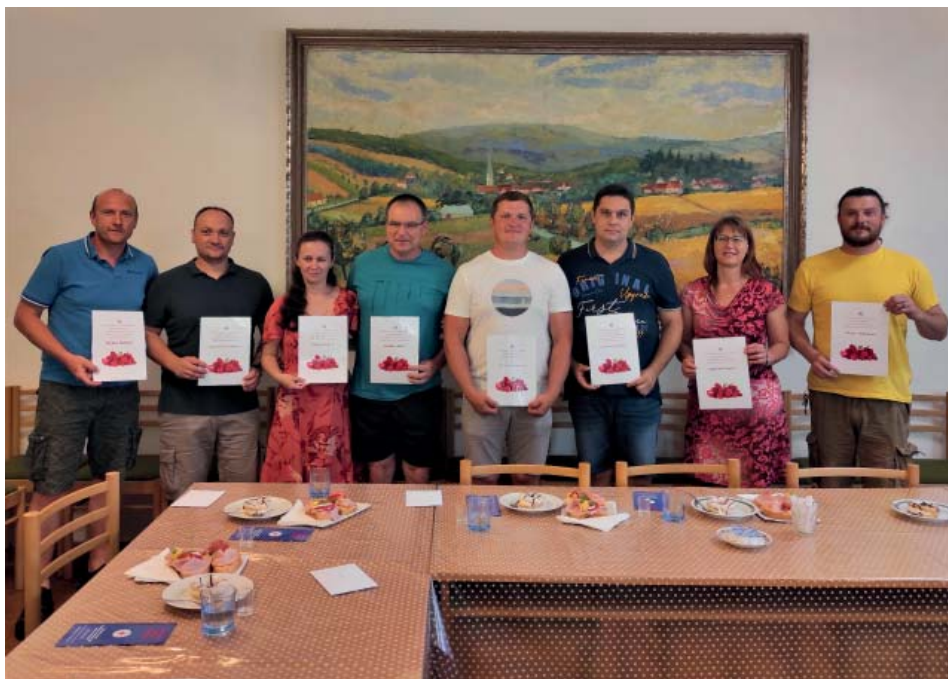
Dárci krve 12.7.2023