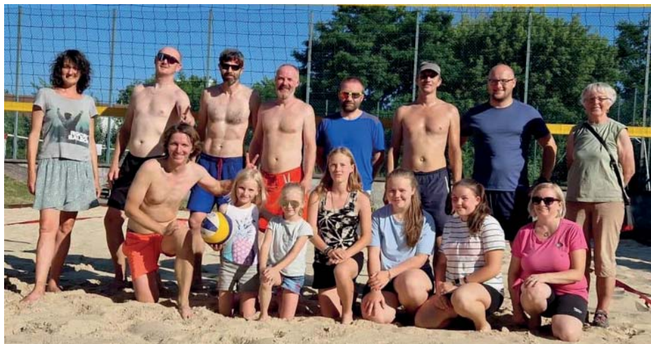
Turnaj v beach volejbalu 15.7.2023