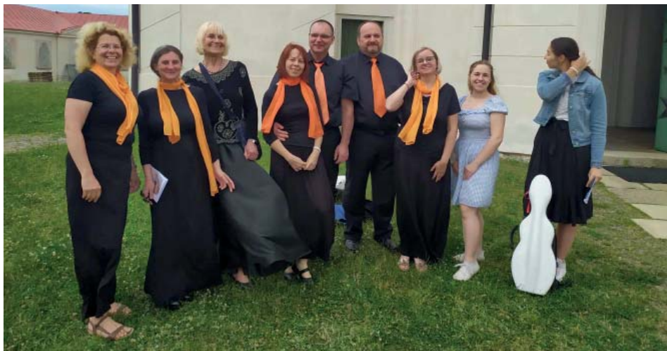
Chrámový sbor Březolupy na nesoutěžní přehlídce Sborování ve Žďáru nad Sázavou