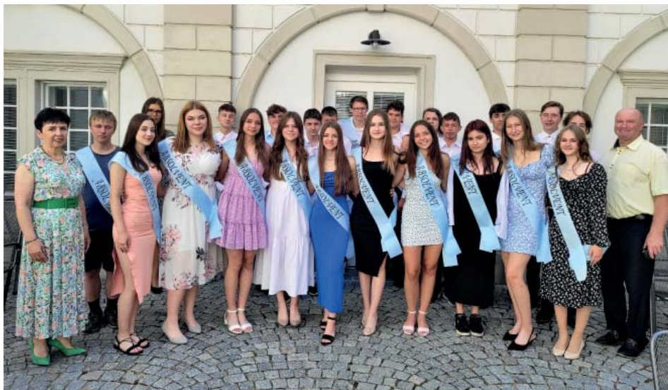
Rozloučení s žáky 9. ročníku