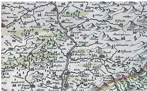
Březolupy a okolí na mapě Komenského (1613–22)

Úvodní mapou v tomto bloku je První vojenské mapování z let 1764–68. Tato mapa vznikla za panování rakouského císaře Josefa II. Je již v konkrétním měřítku (přibližně 1 : 28 800) a naše obec je na ní pod názvem „Prezolup“. Měření prováděli důstojníci prohlídkou terénu tzv. od oka, a není tudíž zcela přesná.