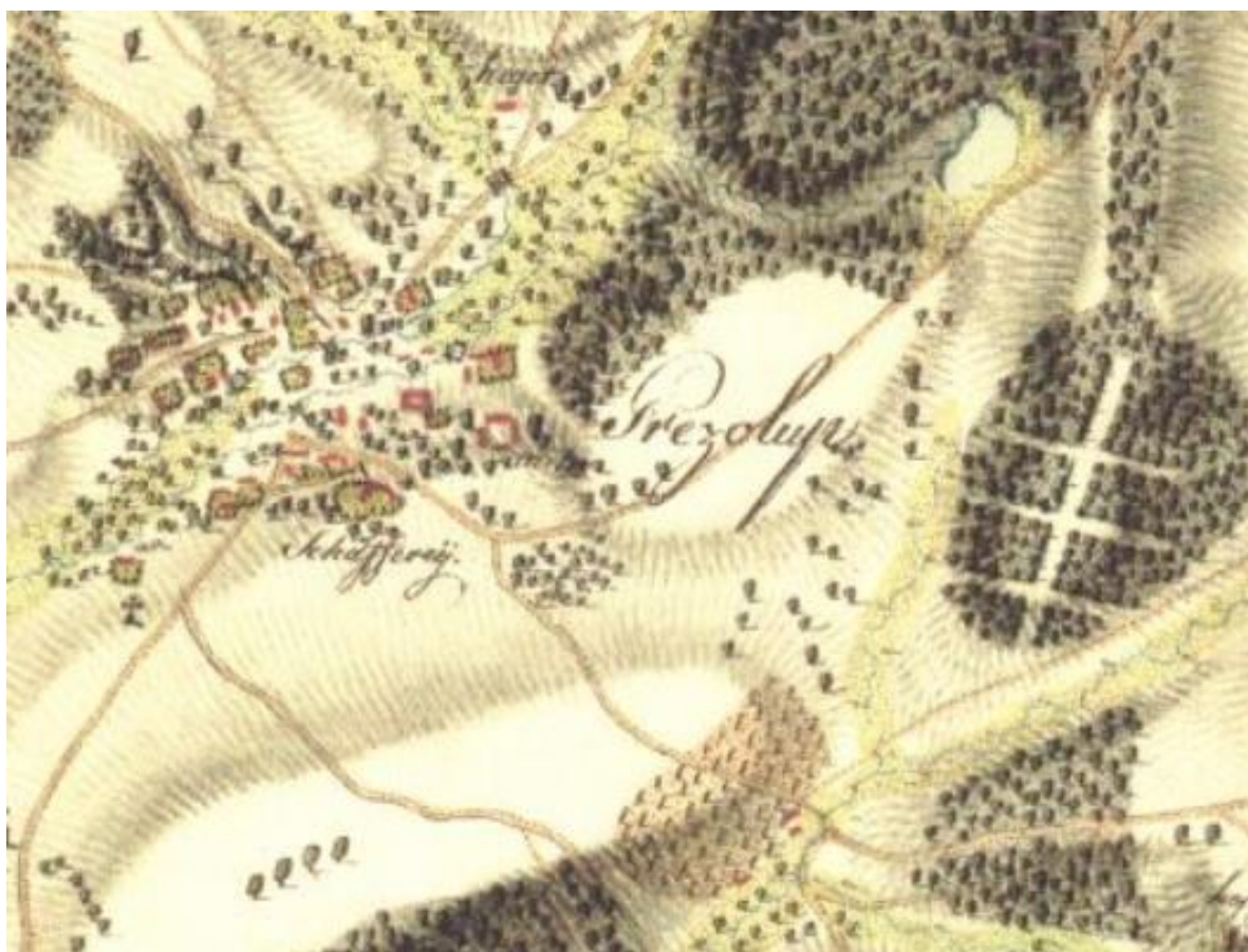
Březolupy s jezerem u lesa Kaménka na mapě Prvního vojenského mapování (1764-68)

Úvodní mapou v tomto bloku je První vojenské mapování z let 1764-68. Tato mapa vznikla za panování rakouského císaře Josefa II. Je již v konkrétním měřítku (přibližně 1: 28800) a naše obec je na ní pod názvem „Prezolup“. Měření prováděli důstojníci prohlídkou terénu tzv. od oka a není tudíž zcela přesná.