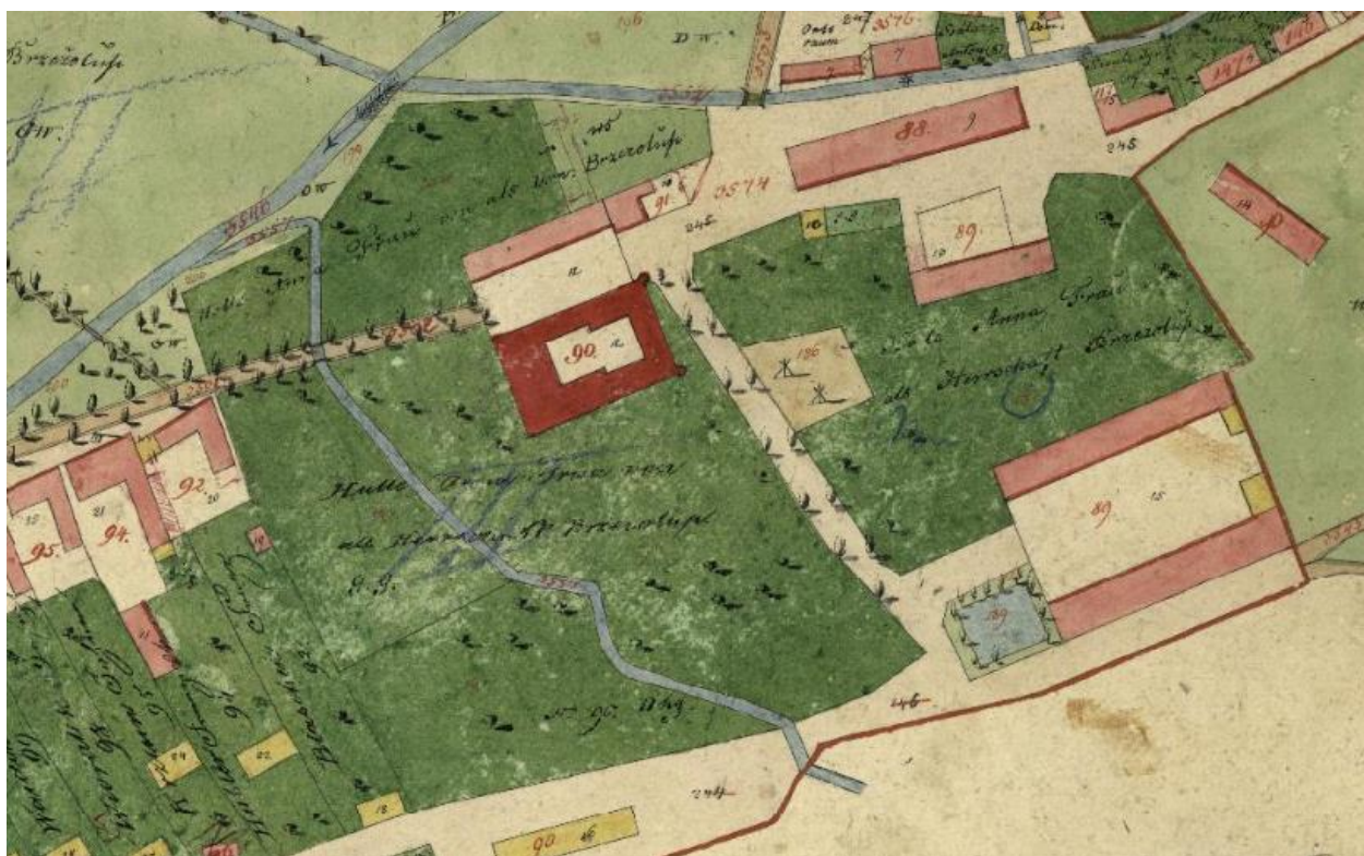
Zámek a okolí na mapě Stabilního katastru (1828)

V této části se vrátím ke své oblíbené a v několika článcích již citované Mapě stabilního katastru, která je pro Březolupy z roku 1828. Pořízena byla v první polovině 19. století za účelem získání dostatečně přesného měřického podkladu pro stanovování pozemkové daně. Nejdříve byly přesně vymezeny hranice pozemků. Takto označené pozemky byly posléze zaměřeny. Přesné trigonometrické zaměření provádělo v terénu několik polních měřičských skupin.