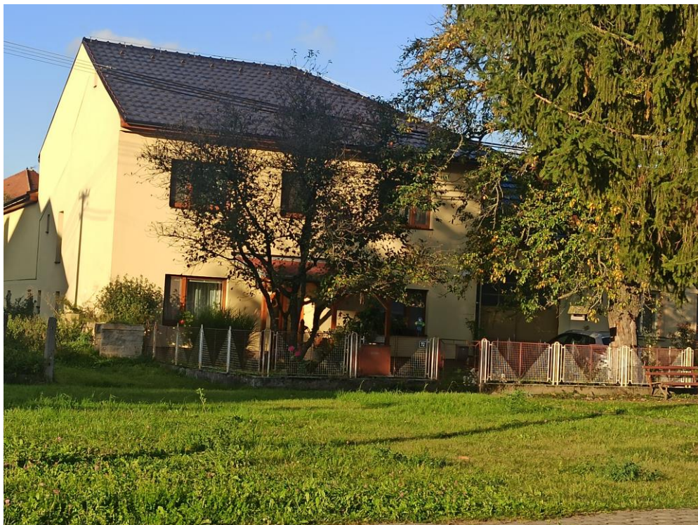
Současná fotografie domu č. 72