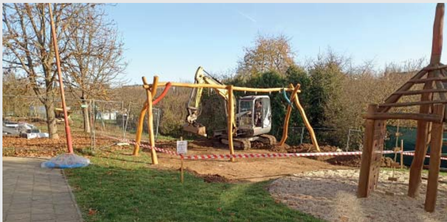
Součástí stavby Dětské skupiny v areálu MŠ je i nová houpačka