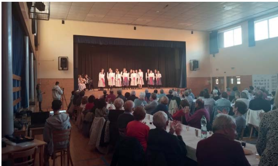
Beseda s důchodci, 10.11.2024