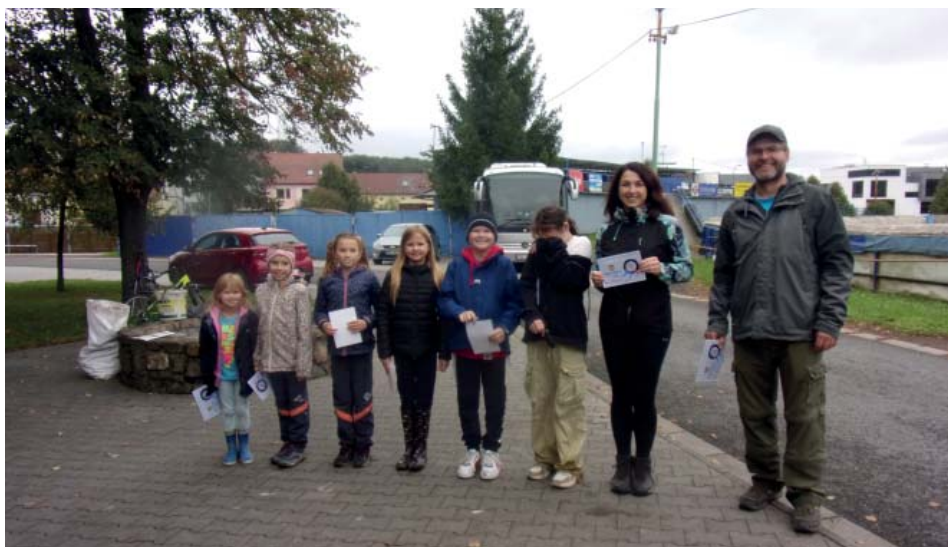
S buzolou a mapou, 5.10.2024