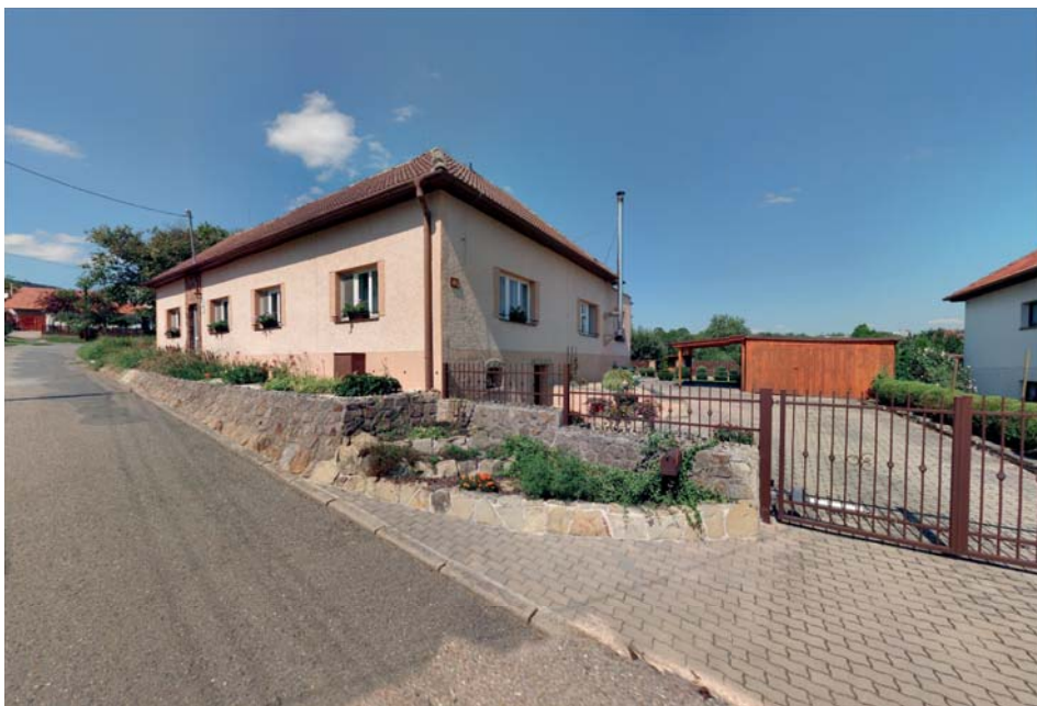
Současná fotografie domu č. 37