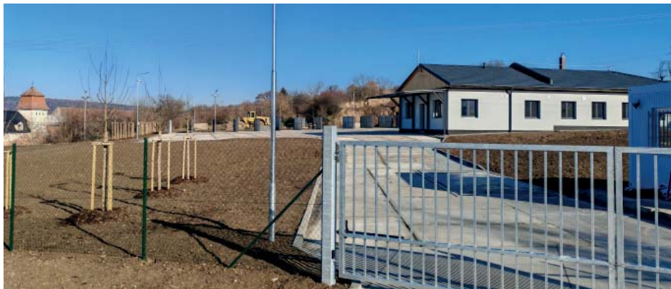
Nové odpadové centrum

Přes prázdniny byla zrealizována dotační akce Rekonstrukce gastro zařízení ve školní kuchyni na MŠ s celkovým nákladem kolem 7,0 mil Kč s dotací ze Státního fondu životního prostředí přibližně 50%. Nová kuchyně už je v provozu a snad bude našim strávnickům i nadále chutnat. V příštím roce chceme navázat přístavbou místnosti pro výdej jídlonosičů.