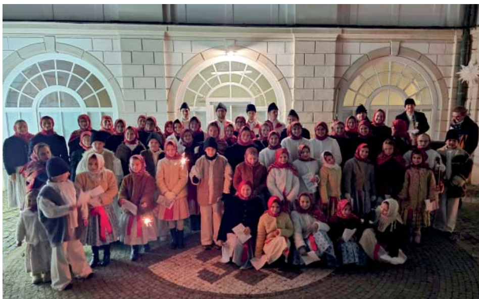
Vánoční koledování na zámku, 7.12.2024