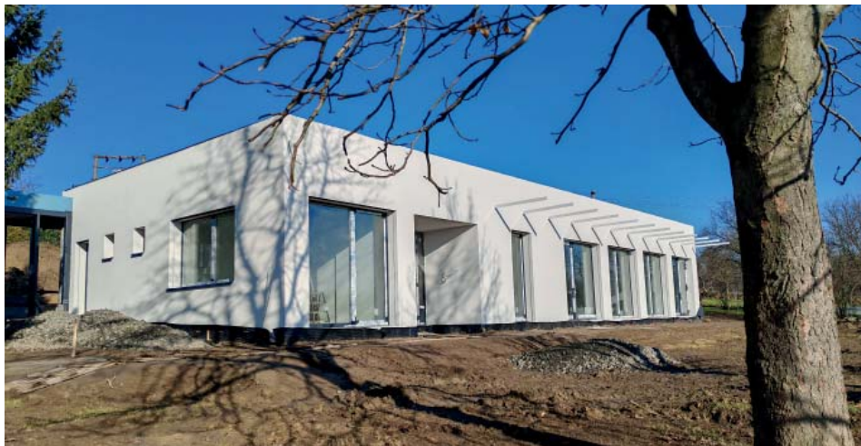
Nová budova dětské skupiny v areálu MŠ již pomalu dostává finální podobu

Dětská skupina má plánovanou kapacitu 24 dětí a je určena pro děti ve věku 1-7 let a na její provozování jsme vybrali spolek Borky a Borci z Topolné. Plánujeme otevřít od 01. ledna 2025 a již nyní se mohou rodiče dětí přihlásit. Rodiče březolupských dětí zde budou platit stejný poplatek jako v MŠ, tj. 500,- Kč měsíčně + stravu, mimo březolupští pak 2.500,- Kč + stravu. Dětskou skupinu plánujeme v optimálním stavu jako naše předškolkové zařízení pro děti 1-3 let.