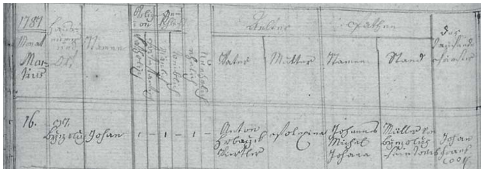
První zápis o rodu Hrbáček na č. 37