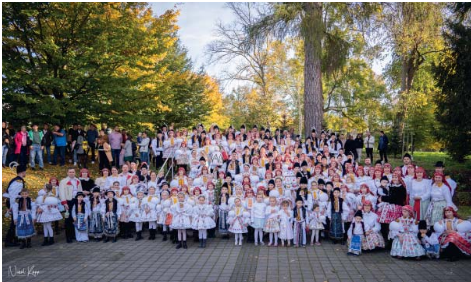
Hody v Březolupech, 19.10.2024