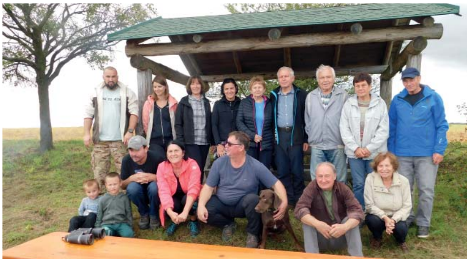
Putování po altánech, 28.9.2024