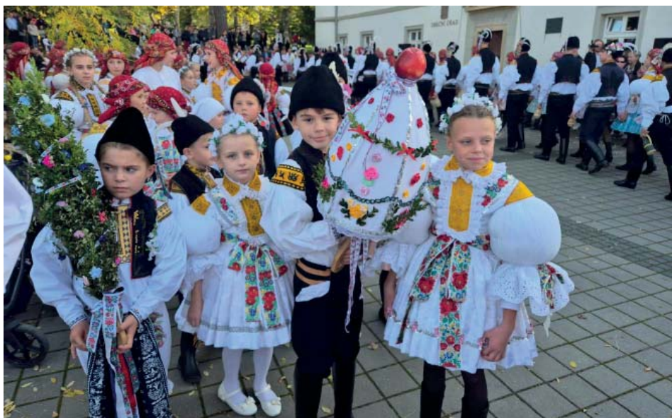
Hody v Březolupech, 19.10.2024