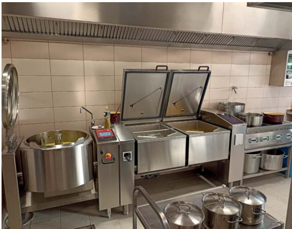
Nové gastro na MŠ