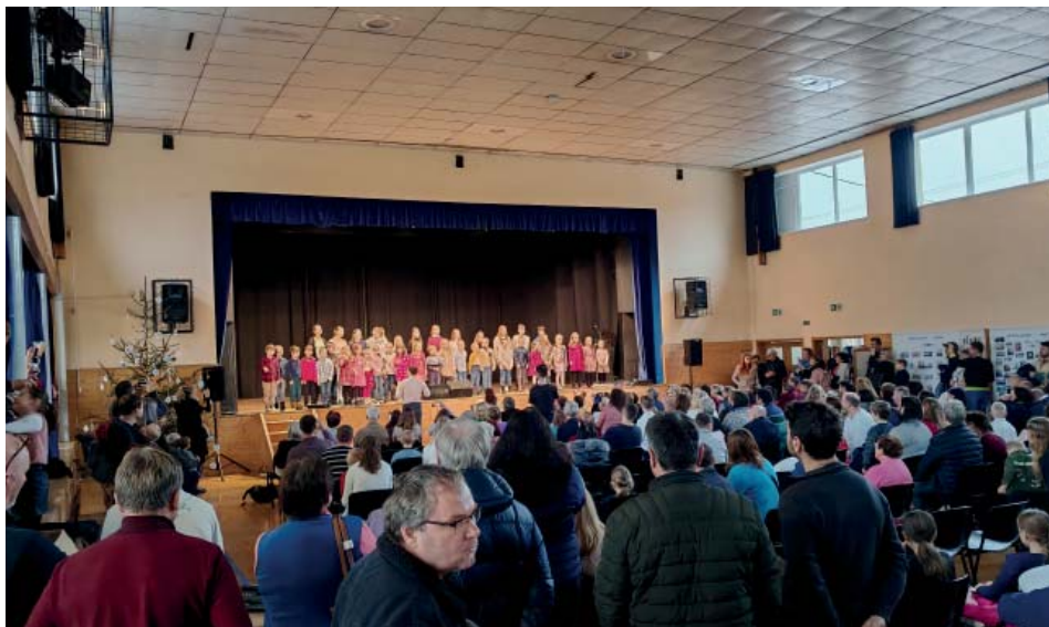
Vánoční jarmark, 7.12.2024