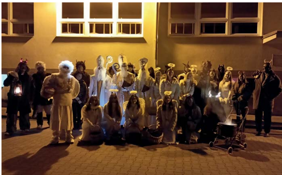
Mikulášská družina, 5.12.2024