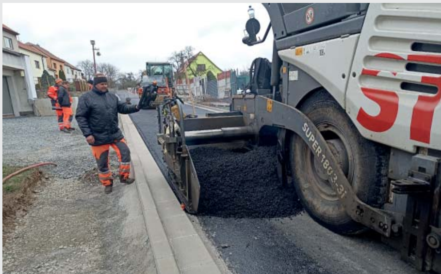
Rekonstrukce místní komunikace a chodníků Čistře finišuje. Hotovo by mělo být do konce roku