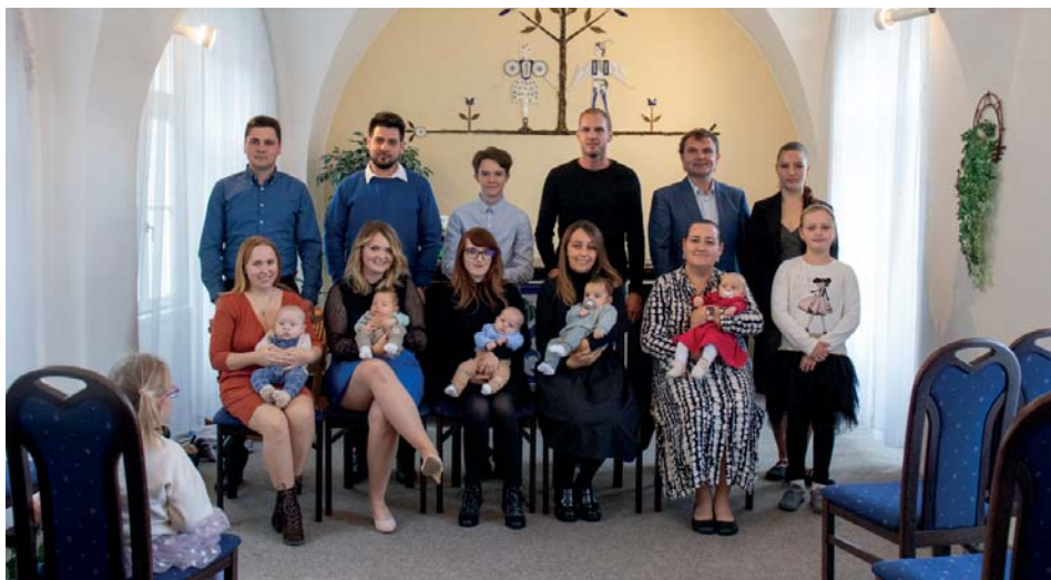
Vítání občánků, 29.9.2024