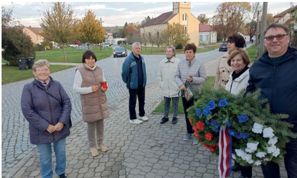
Kladení věnců, 25.10.2024