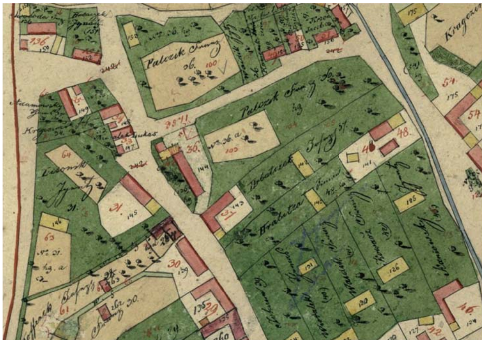
Výrez mapy obce Březolupy z roku 1828 (s domem č.37)

Skutečné vlastníky domů, stejně jako jiných ve všech obcích, lze však najít pouze v Gruntnovních (pozemkových) knihách, v nichž byly zaznamenávány převody majetku. Tyto jsou uloženy v Moravském zemském archívu v Brně. Od minulého článku mám však pro zájemce o hledání svých předků pozitivní informaci. MZA Brno je začíná digitalizovat, a proto zájemci již brzy nebudou muset vyrazet až do Brna osobně. Ti, kteří jsou nedočkaví se mě můžou ozvat, poradím jim, kde na webu najdou „beta“ verzi této digitální části archívu.