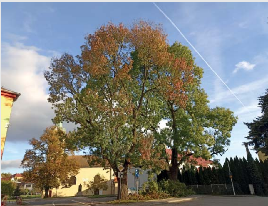
Janasy v centru obce mezi ZŠ a farou se po pádu větší haluze dočkaly dalších větších ořezů