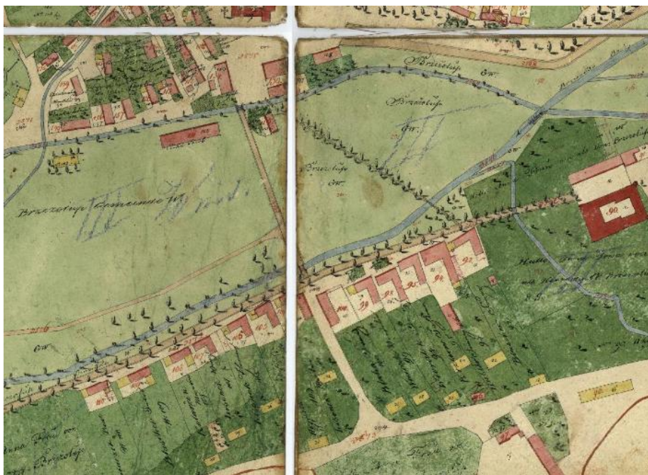
Výřez mapy obce Březolupy z roku 1828 (s domem č.105)

Dále připomenu, že prvním mapovým zdrojem, kde jsou již zakresleny domy a uvedeni i jejich vlastníci, jsou mapy pořízené při tvorbě Stablního katastru mezi lety 1824 až 1830. Pro Březolupy byla mapa vytvořena roku 1828. I tuto archiválii si je možné již prohlédnout z klidu domova na počítači, a to na internetové adrese: www.mza.indikacniskici/skica .