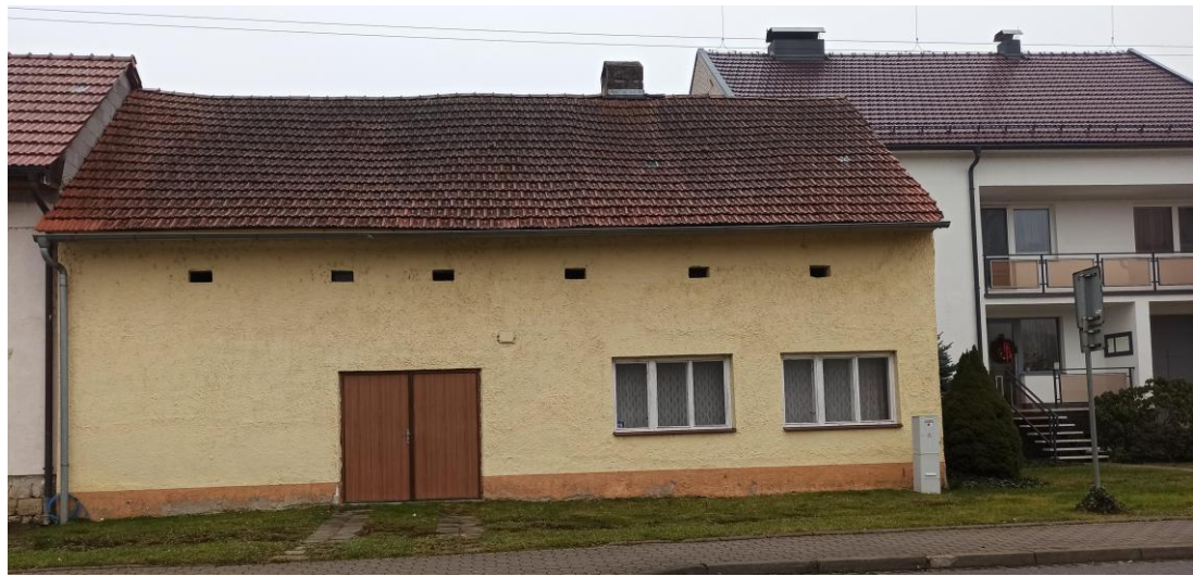
Současná fotografie domu č.105